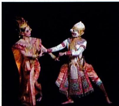
古典舞踊ラーマキアン

タイ料理は地域によって異なり、北部は油の使用量が多いですがマイルドです。中央部の食事はグリーンカレーや野菜炒めで、南部では豊富な魚介類が有名です。