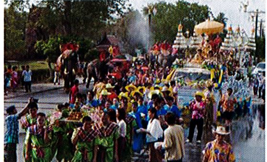
ソクランフェスティバル

旧正月は4月13日~4月15日で、「ソクランフェスティバル」と呼ばれています。国民が新年を祝い、水をかけあいます。