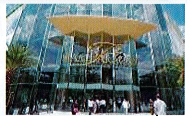
サイアムパラゴン