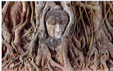
ワット・マハタート

ワット・ブラシーサンペットは王朝の中で最も重要な寺院で王様と子供やいとこが納められています。