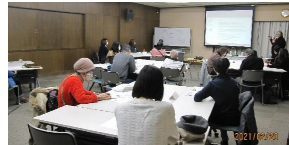
メモを取りながら英語交流を試みる参加者

アンケート結果：“パキスタンについて初めて多くを学べた”、“パキスタンを訪ねたい”、“ネイティブと会話して楽しかった”と参加者には大好評でした。