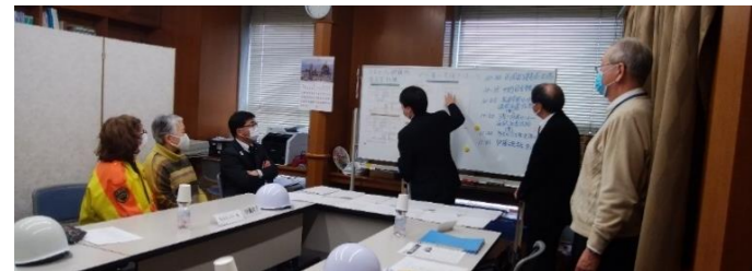
対応の仕方をシミュレーションするスタッフ

10日(水)に協会内に「外国人支援センター」を開設。午前中、防災無線を通じて、長房市民センター、浅川市民センターから英語通訳の派遣要請、午後には台町市民センターからタイ語通訳、横山南市民センターから中国語通訳の派遣要請があり、各々対応をしました。