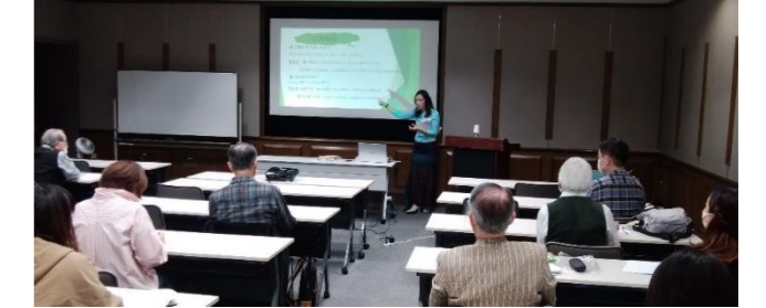
慣れない発音に苦心しながら楽しみました!