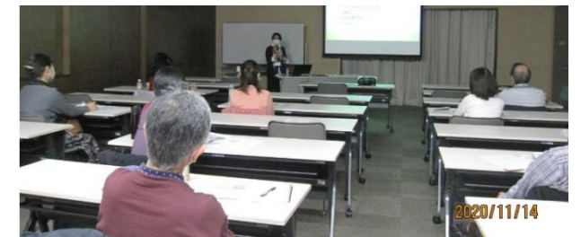
コロナ禍での研修会。距離を取って着席、参加