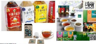
日本で買えるおすすめな紅茶

スリランカと言えば、ブラックティー(紅茶)が有名で、日本で買えるおすすめな紅茶はジャスミンティーだそうです。