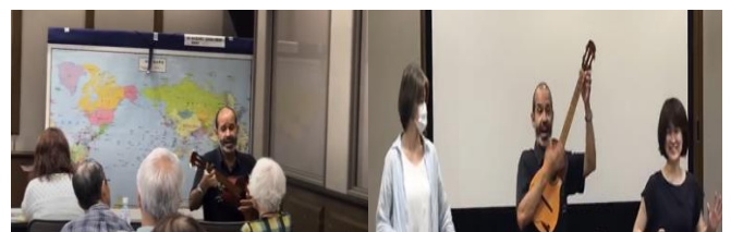
【手拍子やダンスで盛り上がった演奏会】

ベネズエラで最も重要な楽器であるクアトロを用いて、コーヒ・ルンバ等の有名な音楽を10曲以上披露して頂きました。また、スタッフも参加者と一緒になって楽しみました。