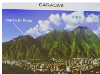
【首都カラカスの風景】

スペイン語や英語を教えるかたわら、介護ヘルパー、ツアーガイド、テレフォンカウンセラー、歌手・ギタリストなど、幅広く活躍しています。