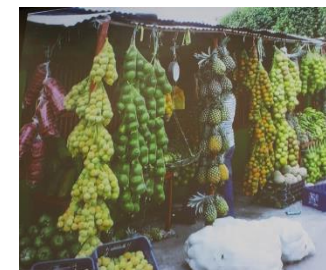
【トロピカルフルーツ】

首都はカラカスで、南米の玄関口でアンデス山脈やアマゾン、テーブルマウンテン、平野、美しいビーチの観光が有名です。