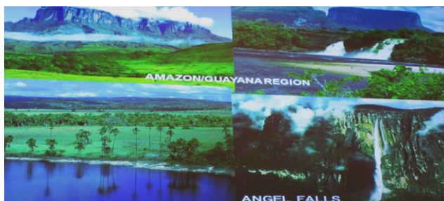
【テーブルマウンテンやエンジェルフォール】

アマゾンは世界で最も大きなジャングルで、テーブルマウンテンや世界で一番標高の高い滝である、Angel Fallsがあります。