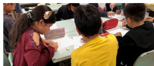
多文化キッズサロン 北野学習支援教室で

現在、協会の活動は「多文化キッズサロン」という大きな課題に取り組み始めております。ことに、外国人子弟に対する日本語教育、高校進学支援を含め、日々の学習活動支援を通して、彼らが日本社会にしっかりと受け入れられる素地を造っていくことが重要だと思っております。そして、人種・文化・伝統などの枠を超えた「地球市民」という視点に立ち、「多文化共生」社会構築という大きな目標に向かって、皆様のお力添えをいただきながら、一歩一歩進んで参りたいと決意致しております。 本年も何卒宜しくお願い申し上げます。